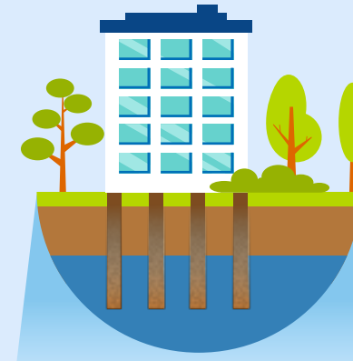
5. Stijging grondwater 6. Paalrot 7. Verschilzetting