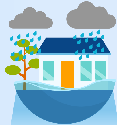
2. Hevige neerslag 3. Overstromingsdiepte 4. Overstromingskans